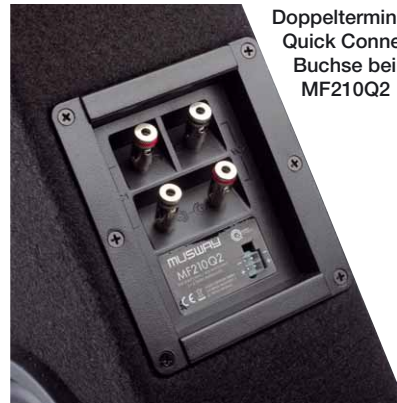
Doppelterminal und Quick Connect Buchse beim MF210Q2

immer macht sich bei mutwilligem Quälen mit Tiefbass die Passivmembran irgendwann bemerkbar - ein Reflexrohr würde dann Strömungsgeräusche machen. Die Abstimmfrequenz des Resonators liegt frei stehend bei 45,5 Hz, in Downfireanordnung bei 43 Hz. Der Woofer profitiert tatsächlich untenrum vom Downfire, die halb eingeschlossene Luft unter dem Gehäuse wirkt als zusätzliche Luftlast bzw. wie ein Zusatzgewicht auf der Passivmembran oder eine Verlängerung deines Bassreflexrohrs. In der Praxis wird es kaum auffallen, der MF210 spielt in allen Lebenslagen mit ausreichend Tiefgang. Gerade Rock und Charts gelingen schön kräftig mit druckvollem Tiefgang. Für rasante Bassläufe gibt es tatsächlich Besseres, obwohl der MF210 durchaus sauber spielt. Völlig gefallen kann jedoch sein Allroundtalent, es klingt immer kräftig und ausgewogen über den gesamten Bassbereich.