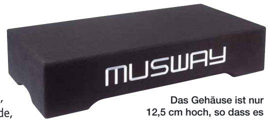
Das Gehäuse ist nur 12,5 cm hoch, so dass es unauffällig im Kofferraum Platz findet

„Praxisgerechter Subwoofer mit prima Performance.“