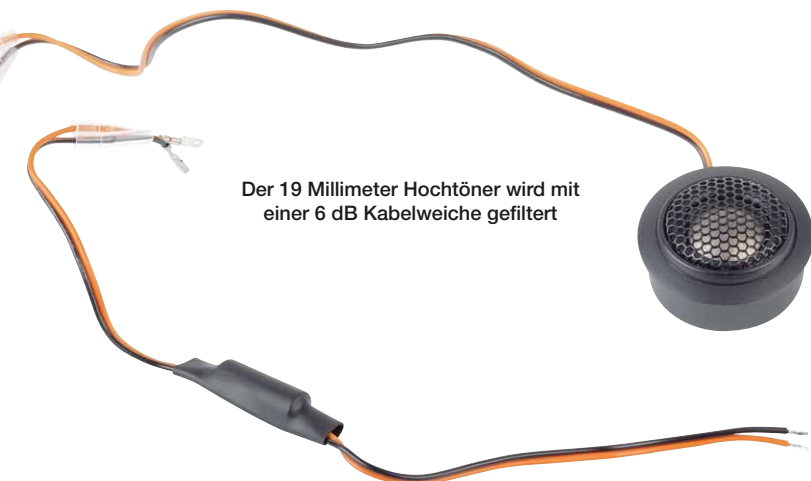
Der 19 Millimeter Hochtöner wird mit einer 6 dB Kabelweiche gefiltert